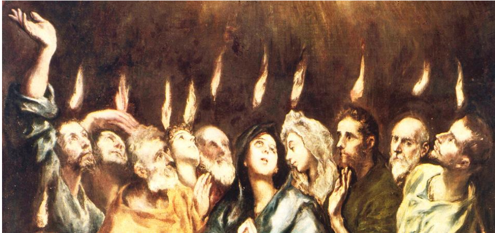
Ausschnitt des Ölgemäldes "Ausgießung des Heiligen Geistes" von El Greco im Prado/Madrid.