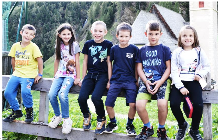
Die 6 ERSTKOMMUNIKANTEN von Rabenstein:

und das Gebetsgedenken für die Herrschn Familie – als Dank & Bitte 171